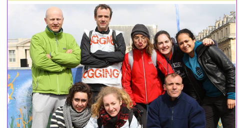
L'équipe SCP15 à la SoMad 2015, après l'effort !!!