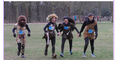
Une partie de l'équipe SCP15, pendant la SoMad 2015